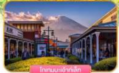
โทเทมเบะเฮ้าท์เอนท์