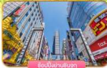
ชิบุงิยามาชิบุจุกุ