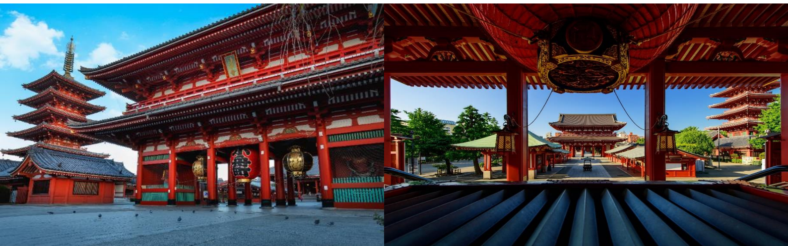
วัดแห่งนี้