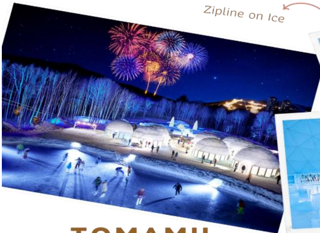
Zipline on Ice

จากนั้นนำท่านเดินทางสู่ TOMAMU ICE VILLAGE ซึ่งตั้งอยู่ใน โฮชิโนะรีสอร์ทโทมามุ (Hoshino Resort Tomamu) เป็นหมู่บ้านชั่วคราวที่สร้างขึ้นจากการแกะสลักน้ำแข็งในช่วงฤดูหนาวเท่านั้น บ้านน้ำแข็งแต่ละหลังมีการประดับประดาแสงไฟสีสันต่าง ๆ ใ้ห้องงดงามมากยิ่งขึ้น นอกจากนี้ให้ท่าน เก็บภาพความสวยงามของบ้านน้ำแข็งแล้วยังมีกิจกรรมอื่น ๆ อีกมากมาย เช่น Zipline on Ice จะเคลื่อนตัวลงมาเป็นระยะทางประมาณ 60 เมตร ระหว่างทางคุณจะได้ชื่นชมทิวทัศน์ของหิมะ และ ลานน้ำแข็งที่น่าอัศจรรย์ Ice Bakery & Cafe คาเฟ่ที่ให้บริการเครื่องดื่มร้อน และขนม ที่ให้ท่าน นั่งทานบนโต๊ะและเก้าอี้น้ำแข็ง Ice Bar บาร์ที่บริการเครื่องดื่มประเภทค็อกเทล และเครื่องดื่ม แอลกอฮอล์อื่น ๆ หลายชนิด ที่เสิร์ฟในแก้วน้ำแข็งสวย ๆ เป็นต้น (**ราคาทัวร์ไม่รวมค่ากิจกรรม และค่าเครื่องดื่ม Ice Bar, Ice Bakery&Cafe**) จากนั้นนำท่านเดินทางกลับสู่เมืองซัปโปโร