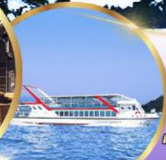
ล่องเรือ ทะเลสาบ ฮามานะ