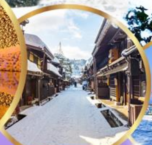
ทาคายาม่า