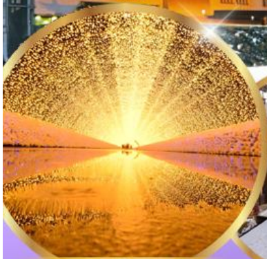
นาบาระ โนะ ซาโตะ