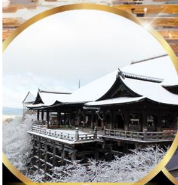
วัด คิโยมิสึ