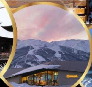
Snow peak land hukuba