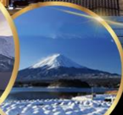
สวน โออิชิ พาร์ค