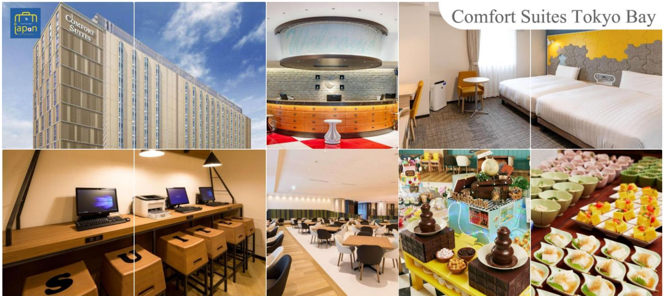
Comfort Suites Tokyo Bay

COMFORT SUITES TOKYO BAY หรือเทียบเท่าระดับเดียวกัน