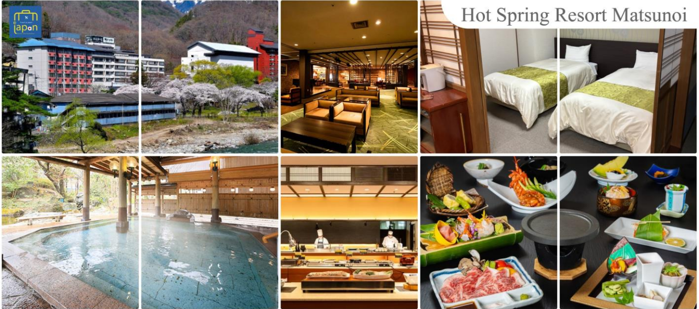
Hot Spring Resort Matsunoi

หลังอาหารให้ท่านได้ผ่อนคลายกับการแช่น้ำแร่ธรรมชาติ เชื่อว่าถ้าได้แช่น้ำแร่แล้ว จะทำให้ผิวพรรณสวยงามและช่วยให้ระบบหมุนเวียนโลหิตดีขึ้น