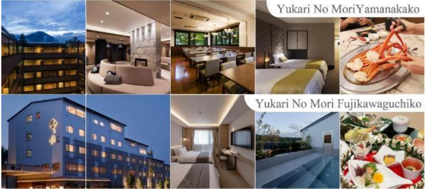
Yukari No Mori Yamanakako

หลังอาหารให้ท่านได้ผ่อนคลายกับการแช่น้ำแร่ธรรมชาติ เชื่อว่าถ้าได้แช่น้ำแร่แล้ว จะทำให้ผิวพรรณสวยงามและช่วยให้ระบบหมุนเวียนโลหิตดีขึ้น