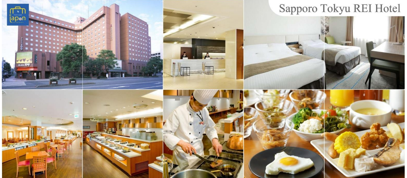
Sapporo Tokyu Rei Hotel

SAPPORO TOKYU REI HOTEL หรือเทียบเท่าระดับเดียวกัน