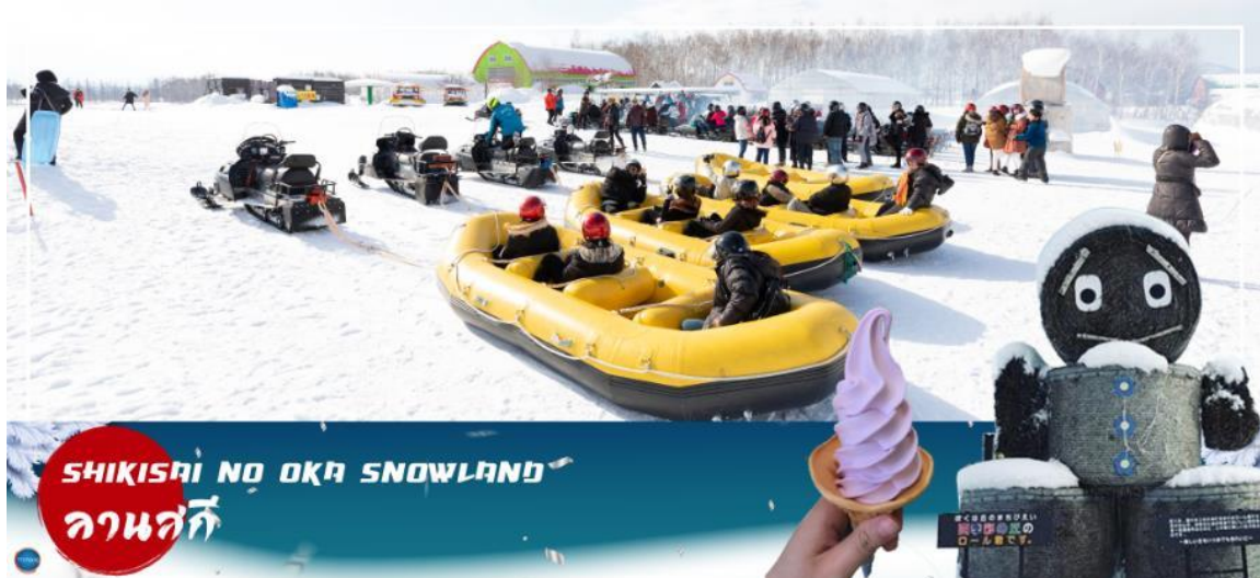
SHIKISAI NO OKA SNOWLAND ลานสกี

เมืองอาซาฮิคาว่า – เมืองฟูราโน – ลานสโนว์ เวิลด์ (กิจกรรมทางหิมะ) – หมู่บ้านเพนนิยาย นิงเกิ้ลเทอเรส – เมืองซัปโปโร – ถนนช้อปปิ้งทานุกิโคจิ