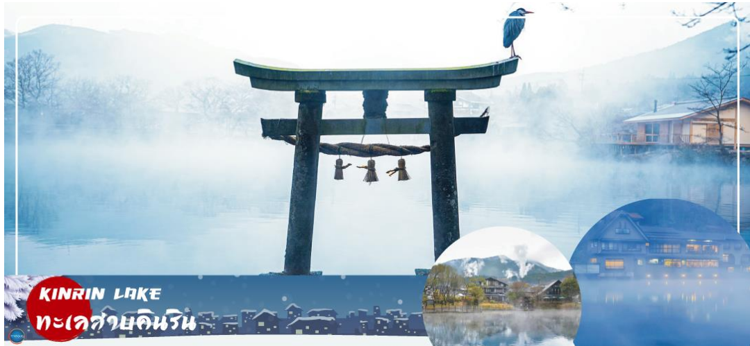
KINRIN LAKE ทะเลสาบคินริน