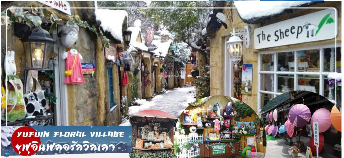
YUFUIN FLORAL VILLAGE หมู่บ้านฟลอรัลวิลเลจ