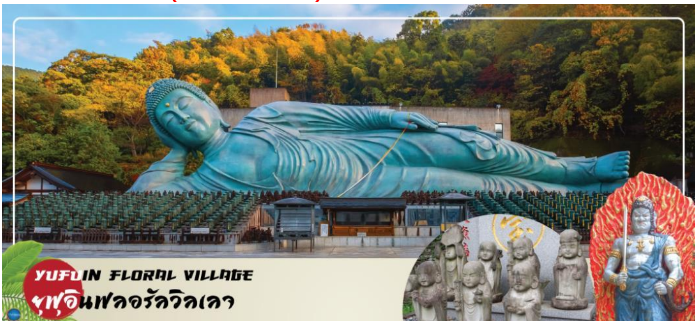
YUFUIN FLORAL VILLAGE

เลือกรับประทานอาหารกลางวัน ณ หมู่บ้านยูฟุอินตามอัตราตั้ย(3) Cash Back ท่านละ 1000 เยน (จ่ายโดยโค้ดพนักงาน)