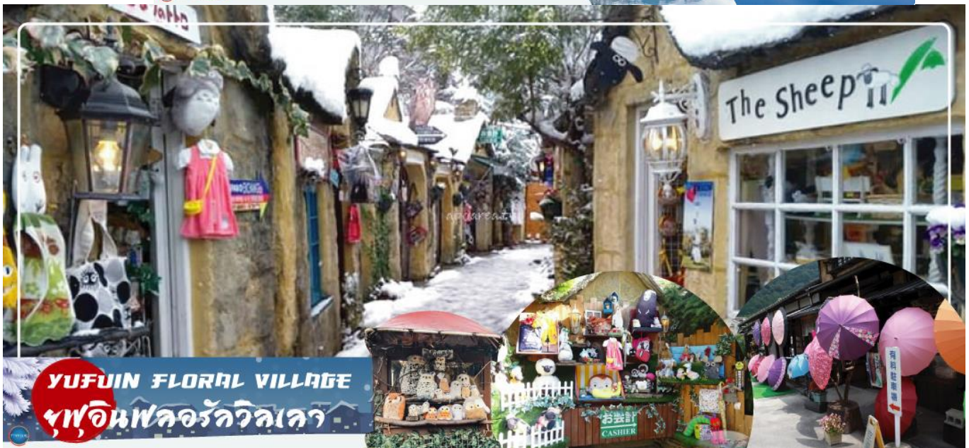
YUFUIN FLORAL VILLAGE