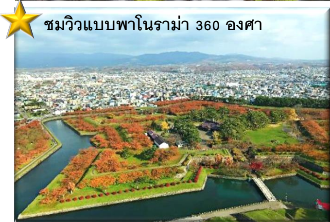
★ ชมวิวแบบพาโนรามา 360 องศา