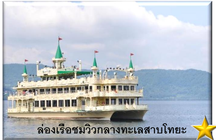
★ ล่องเรือชมวิวกกลางทะเลสาบไทยะ