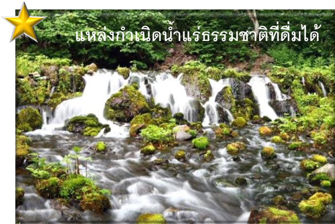
★ แหล่งกำเนิดน้ำแร่ธรรมชาติที่ดื่มได้