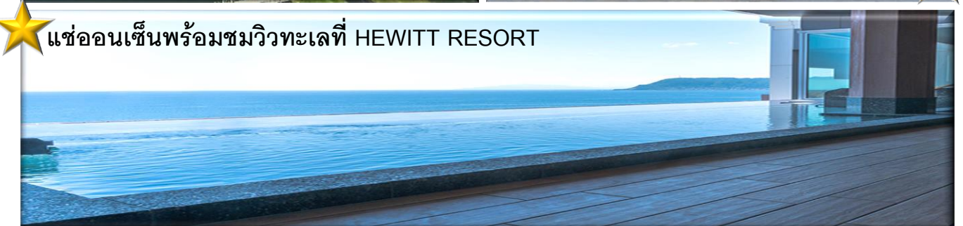
★ แอ่ออนเซ็นพร้อมชมวิวทะเลที่ HEWITT RESORT