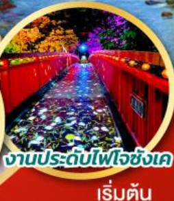
งานประดับไฟโจซังเค เริ่มต้น