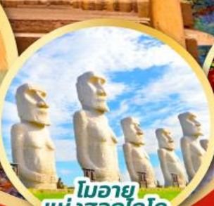
โมอาย แห่งฮอกไกโด