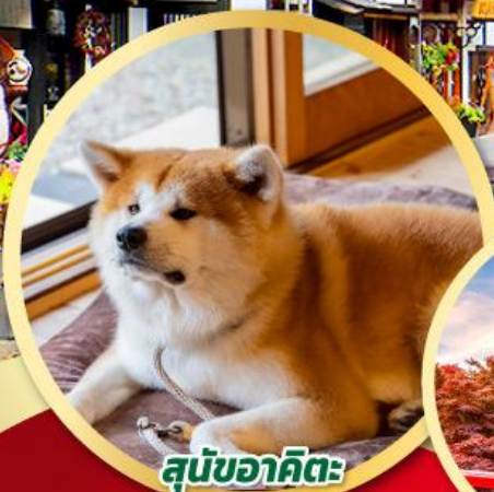
สุนัขอาคิตะ