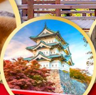
ปราสาทอิโรซากิ