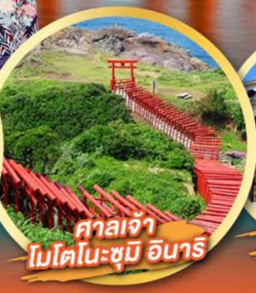
ศาลเจ้า โมโตโนะซุมิ อินาริ