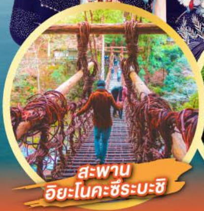
สะพาน ฮิยะโนะคะชิระบะชิ