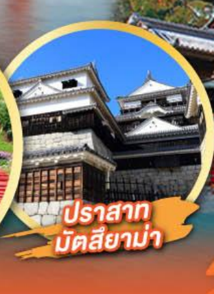
ปราสาท มัตสึยาม่า