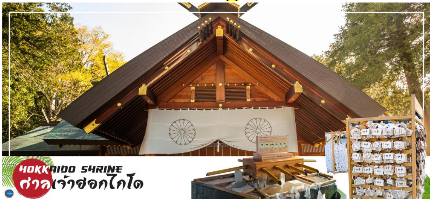
HOKKAIDO SHRINE ศาลเจ้าฮอกไกโด

จากนั้นนำท่านเดินทางสู่ เมืองซัปโปโร (SAPPORO) (ใช้เวลาเดินทางประมาณ 1.20 ชั่วโมง) นำท่านขอพร ศาลเจ้าฮอกไกโด (Hokkaido Shrine) หรือเดิมชื่อ ศาลเจ้าซัปโปโรเปลี่ยนเพื่อให้สมกับ ความยิ่งใหญ่ของเกาะเมืองฮอกไกโด ศาลเจ้าชินโตนี้คอยปกป้องรักษาให้ชนชาวเกาะฮอกไกโดมีความสงบสุขถึงแม้จะไม่ได้มีประวัติศาสตร์อันยาวนาน