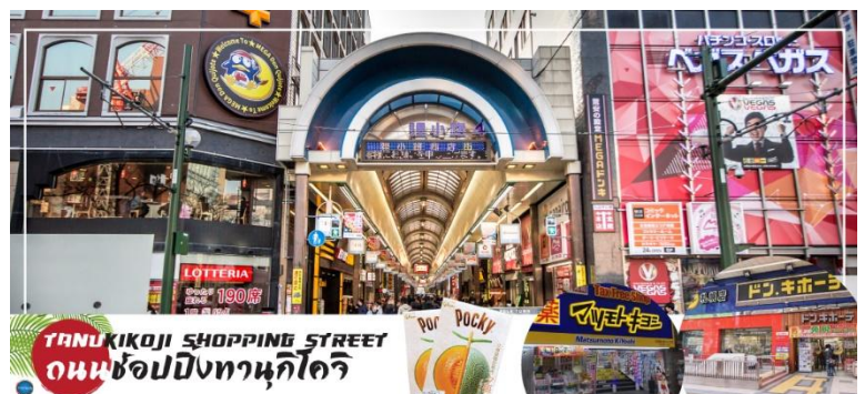
TANUKIKOJI SHOPPING STREET ถนนช้อปปิ้งทานุกิโคจิ

จากนั้นนำท่านสู่ ถนนช้อปปิ้งทานุกิโคจิ (Tanukikoji Shopping Street) เป็นย่านการค้าเก่าแก่ของเมืองซัปโปโร โดยมีพื้นที่ทั้งหมด 7 บล็อก ภายในนอกจากจากจะเป็นแหล่งรวมร้านค้าต่างๆ อย่างร้านขายกิโมโนเครื่องดนตรีวีดีโอ โรงภาพยนตร์แล้วยังมีร้านอาหารมากมาย ทั้งยังเป็นศูนย์รวมของเหล่าวัยรุ่นด้วย เนื่องจากมีเกม เซ็นเตอร์ และตู้หนีบตุ๊กตามากมาย ร้านดองกิ ร้าน 100 เยน นอกจากนี้ที่นี่ยังมีการตกแต่งบนหลังคาด้วยตุ๊กตาทานุกิขนาด