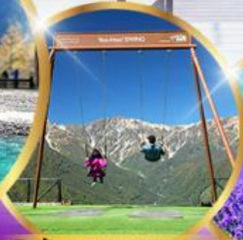
ชิงช้า Yoo hoo! Swing