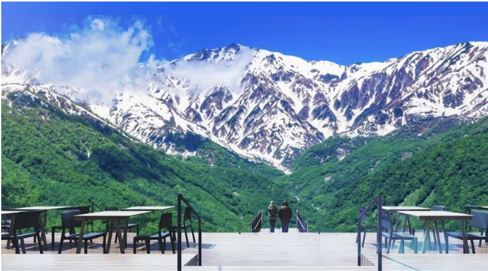
HAKUBA MOUNTAIN HARBOR

ไม่พลาดกับการชมวิวแบบพาโนรามา ณ Hakuba Mountain Harbor ด้วยทัศนียภาพที่เหนือ ชั้นของภูเขาโดยรอบ จุดเด่น คือ ระเบียง “Hakuba Sanzan” ที่สามารถเห็นเทือกเขาแอลป์แบบ 360 องศาได้อย่างสวยงามในทุกฤดูสามารถยืนถ่ายรูปและดื่มด่ำกับบรรยากาศได้อย่างเต็ม อิม ในบริเวณเดียวกันยังมีร้านเบเกอรี่ โดยทางเข้ามีที่นั่งบนระเบียง สามารถเพลิดเพลินไป กับการจิบเครื่องดื่มอุ่น ๆ พร้อมชมบรรยากาศตามอัธยาศัย