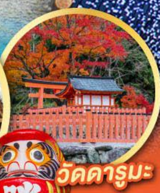
วัดคารุมะ