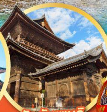
วัดนินเซนจิ