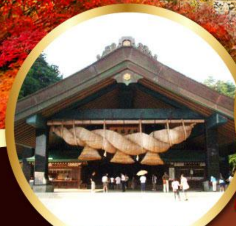
ศาลเจ้าอิชิโมะโกะ