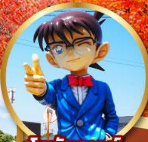
โคนันทาวน์