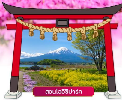
สวนโออิชิปาร์ค