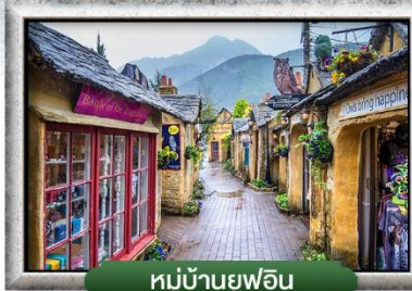
หมู่บ้านยูฟูอิน