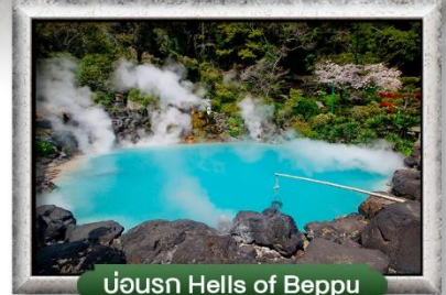
บ่อน้ำ Hells of Beppu