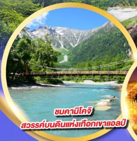
ชมคามิโคจิ

นั่งกระเช้าลอยฟ้า 2 ชั้น ชินโฮทากะ หนึ่งเดียวในญี่ปุ่น แลนด์มาร์กยอดฮิตของโอคุซิดะ