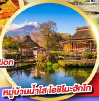
หมู่บ้านน้ำใส โอชิโนะซึกิโก