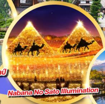
Nabana No Sato Illumination