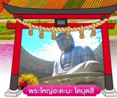
พระใหญ่อะตะมะ ไดบุตสึ