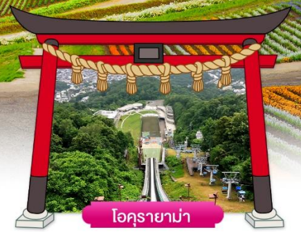
โอคุรายามา