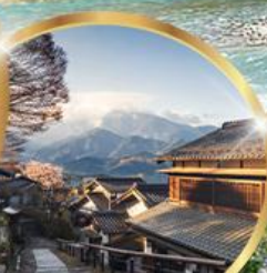
มาโกเมะจุกุ