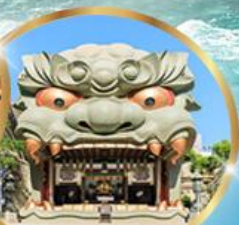
ศาลเจ้านิมะ ยาชากะ