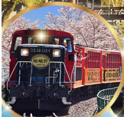
รถไฟสายโรแมนติก