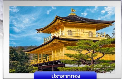
ปราสาททอง