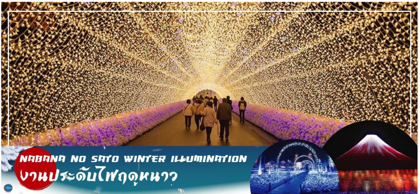
เก็บภาพประทับใจกลับไปอย่างมากมาย

จากนั้นนำท่านชม งานประดับไฟฤดูหนาว ณ หมู่บ้านนาบะ โนะ ซาโตะ (Nabana no Sato Winter Illumination) เป็นธีมพาร์คสวนดอกไม้ ที่มีทุ่งดอกไม้ให้ชมตลอดทั้ง 4 ฤดูกาล สามารถเที่ยวได้ตลอดทั้งปี ไฮไลท์!!! การประดับไฟขนาดใหญ่ที่สุดในญี่ปุ่น จะมีในช่วงฤดูใบไม้ร่วงตลอดจนถึงปลายฤดูหนาว (ตุลาคม-มีนาคม) จะได้รับความนิยมมากเป็นพิเศษ เนื่องจากมี การแสดงไฟในหลากหลายรูปแบบ ไม่ว่าจะเป็น อุโมงค์แสงไฟ (Tunnel of Light) หรือ การประดับไฟในน้ำ (Water Illumination) อีสาระให้ท่านได้เพลิดเพลินกับอสังการงานประดับไฟที่ไม่ว่าจะหันไปทางไหนก็มีมุมให้