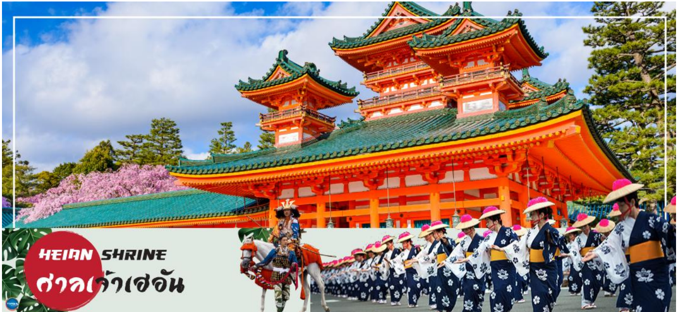
HEIAN SHRINE ศาลเจ้าเฮอัน

เมืองนาโกย่า – เมืองเกียวโต – ศาลเจ้าเฮอัน – การเรียนพิธีชงชาญี่ปุ่น – ศาลเจ้าฟูชิมิอินาริ – เมืองโอซาก้า – LALAPORT & MITSUI OUTLET PARK OSAKA KADOMA