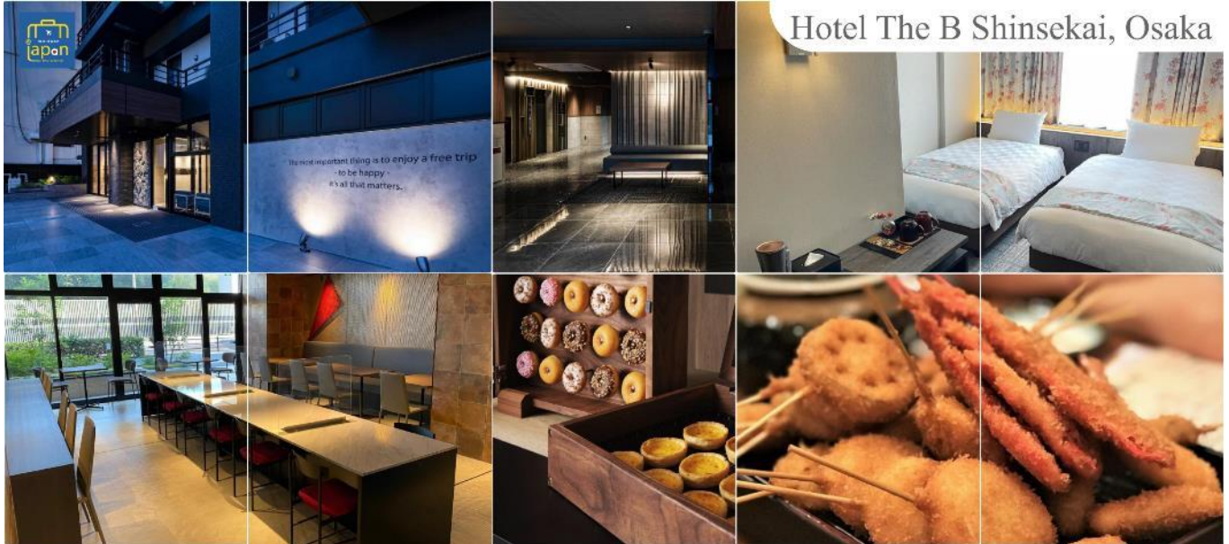
Hotel The B Shinsekai, Osaka

HOTEL THE B SHINSEKAI, OSAKA หรือเทียบเท่าระดับเดียวกัน