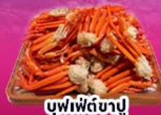
บุฟเฟ่ต์ซาปู