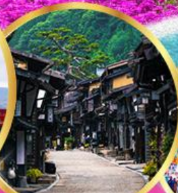
นาราจุกุ