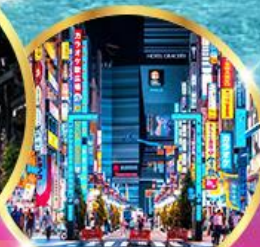
ช้อปปิ้งชินจุกุ