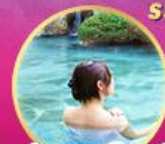
ฟัทออนเซ็น 1 คืน