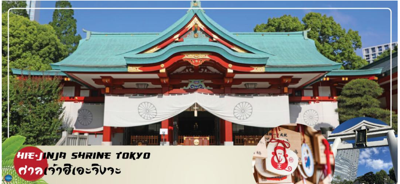
HIE-JINJA SHRINE TOKYO ศาลเจ้าฮิเอะจิงจะ

เมืองนาริตะ – กรุงโตเกียว – ศาลเจ้าฮิเอะจิงจะ – พระราชวังอิมพีเรียล (ด้านนอก) – สะพานแว่นตา – ตลาดปลาซึกิจิ – ย่านโอไดบะ – ห้างไดเวอร์ซิตี – เมืองนาริตะ – อีออนมอลล์ มากุซาริ