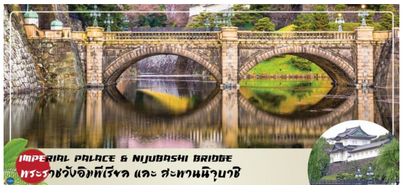
IMPERIAL PALACE & NIJUBASHI BRIDGE พระราชวังอิมพีเรียล และ สะพานนิจูบashi

กรุงโตเกียว ที่มีชื่อเรียกว่าแว่นตาก็เพราะส่วนโค้งที่อยู่ติดกันด้านล่างสะพานนั้นมีรูปร่างเหมือนแว่นตาเมื่อสะท้อนกับผิวน้ำส่วนทางด้านหน้าพระราชวังเป็นอุทยานแห่งชาติโคเคียวไกเอ็น (Kokyo Gaien National Garden) เป็นสวนสาธารณะขนาดใหญ่