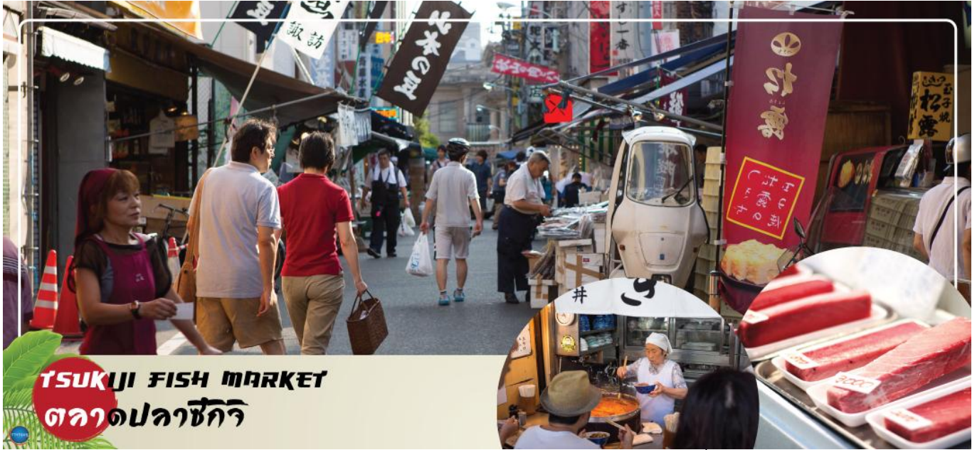
TSUKIJI FISH MARKET ตลาดปลาซึกิจิ

นำท่านสู่ (ใช้เวลาเดินทางประมาณ 20 นาที) ตลาดสดเก่าแก่แห่งหนึ่งของจังหวัดโตเกียวที่มีของอร่อยมากมายหลากหลายให้ท่านได้เลือกซื้อแวะชิมความอร่อยกันอย่างจุใจ ภายในตลาดปลา มีร้านทั้งร้านซูชิ แลปลาสดๆ ทั้งปลาทูน่า ปลาแซลมอน เป็นต้นความอร่อยที่ไม่ควรพลาดอีกมากมายเช่น ไชหวาน ย่างชื่อดัง ข้าวหน้าปลาไหล ก๋วยเตี๋ยวเนื้อตุ๋นรสเด็ด ฯลฯ รวมถึงผลไม้ที่ท่านสามารถเลือกซื้อกลับบ้านได้อีกด้วย