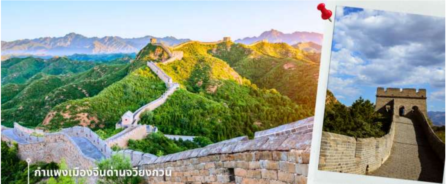
กำแพงเมืองจีนด่านจวิยงกวน

วันที่สาม กำแพงเมืองจีนด่านจวิยงกวน-ร้านยาสมุนไพรจีน-อาบน้ำแร่ (หากเป็นฤดูหนาวเราจะจัดลานสกีเพิ่มให้ท่าน)