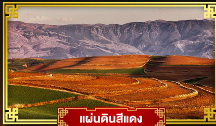
แผ่นดินสีแดง