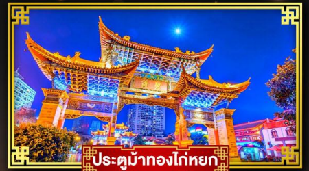
ประตูน้ำทองโก่ทงยก