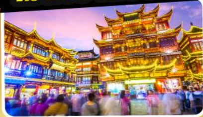
ตลาดร้อยปีเจียงหวงเมี่ยว