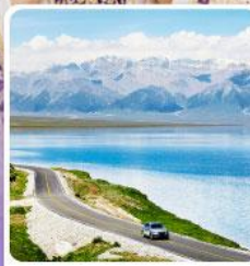
ทะเลสาบไซหลู่