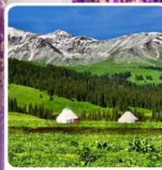
กุ้งห้วยนาลาติ