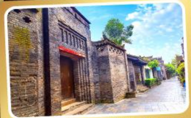
ถนนคนเดินชอยกวางชอยแคบ