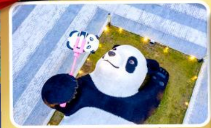
หมีแพนด้าออนเซล์ฟี่