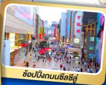
ช้อปปิ้งถนนซิลซิลู่