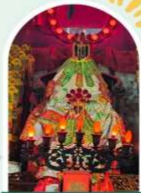
วัดเจ้าแม่กวนอิมของฮำ