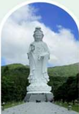
วัดเจ้าแม่กวนอิมชี่ซาน

"ไหว้พระ เสริมดวง เพิ่มสิริมงคลแก่ชีวิต"