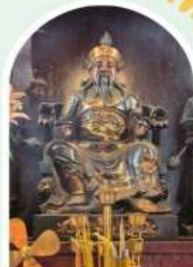
วัดปุกโต