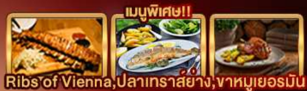
เมนูพิเศษ!! Ribs of Vienna, ปลาเทราสย่าง, จาห์มูเยอร์มิน

ตะลุยพิชิตยอดเขาซูกสปิตซ์ "Top of Germany" เยือนเมืองมิวนิค จัดธุระนาเรือพลาทซ์ สิบห้าสเมืองมรดกโลก เซสท์ ครุมลอฟ เยี่ยมชมปราสาทปราก ย้อนรอยอดีตซาลซ์บูร์ก สวมปีราเบล บ้านเกิดของโมสาร์ท ปราสาทบราติสลาวา มหาวังหารเซนต์มาร์ติน สุดโรแมนติกสองเรือชมความงามแม่น้ำดานูบ จัดธุระสวีเดน พระราชวังฮอฟบวร์ก ดินแดนกับความป่าหลงใหลของ หมู่บ้านริมทะเลสาบฮัลล์สตัดท์ พระราชวังเซินบรุนน์ ปิดท้ายช้อปปิ้งจุใจ