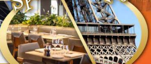
รับประทานอาหารกลางวัน บนหอไอเฟล

ไฮไลท์ในโปรแกรม • สะพานไม้ชาเปล ลูเซิร์น