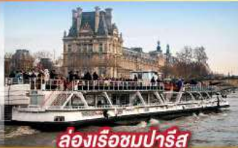
ล่องเรือชมปารีส