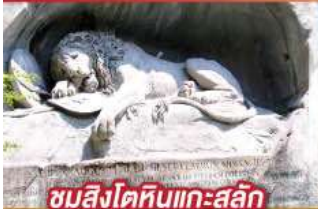
ชมสิงโตหินแกะสลัก