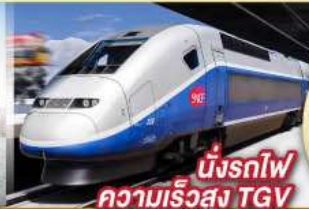
นั่งรถไฟ ความเร็วสูง TGV