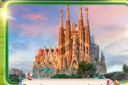
โบสถ์ซากราดา แฟมิลีย