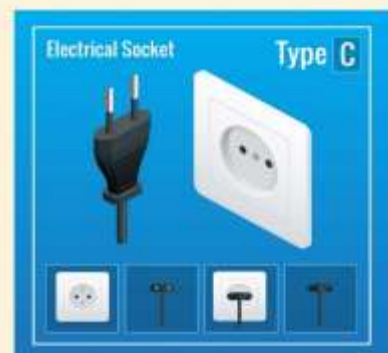
ปลั๊กไฟที่ใช้ที่อียิปต์