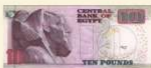
100 ปอนด์อียิปต์