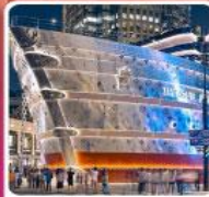
เรือหุหลู่