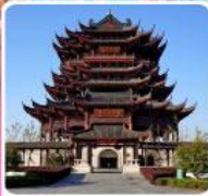
วัดดงหยวน