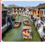
หมู่บ้านโบราณจูเจียเจียว + ล่องเรือ