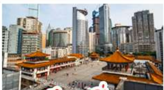
ตึกขุยซิง

พระแกะสลักหินต้าจู้ - หลุมฟ้าสะพานสวรรค์ - เหนียงฟ้า ตึกขุยซิง - ตึกตะเกียบ หมู่บ้านโบราณฉือซีโจว