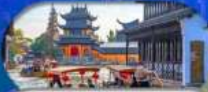
Zhujiajiao Ancient Town สองเรือเมืองโบราณ

เซี่ยงไฮ้ ดิสนีย์แลนด์ เมืองโบราณจูเจียเจียว