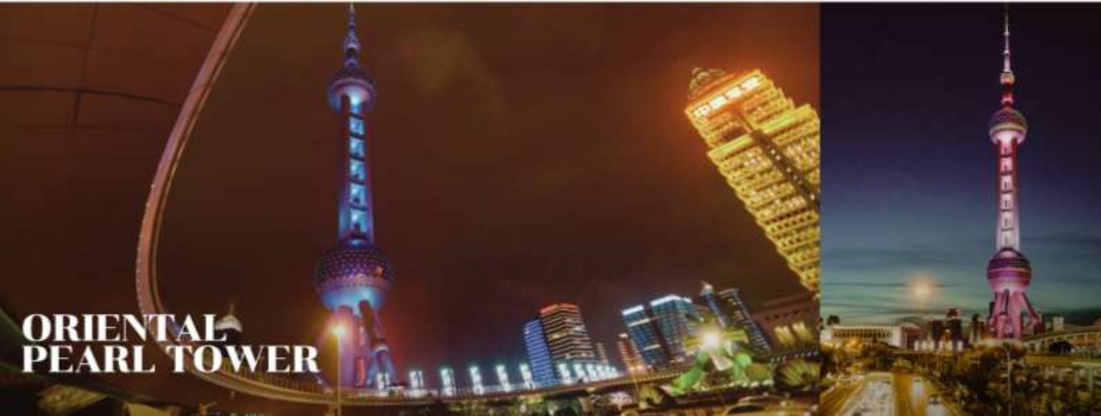
ORIENTAL PEARL TOWER

จากนั้นนำท่านเดินทางสู่ The Bund หรือที่เรียกว่า หาดไว่ทาน ตั้งอยู่ที่เมืองเซี่ยงไฮ้ เป็นบริเวณของจุดชมวิวและทางเดินที่อยู่เลียบบแม่น้ำหวงผู่แม่น้ำสายสำคัญของเซี่ยงไฮ้ อีกทั้งขึ้นชื่อได้ว่าเป็นสถานที่ท่องเที่ยวยอดนิยมของนักท่องเที่ยว เพราะบริเวณนี้สามารถเห็นความสวยงามของหอคอยไข่มุกที่ตั้งอยู่ฝั่งตรงข้ามได้