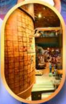
ร้านสตาร์บัคส์