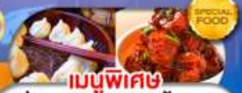
เมนูพิเศษ เสี่ยวหลงเปา หมูน้ำแดง เดินทาง ค.ศ. 69 - มี.ค. 70