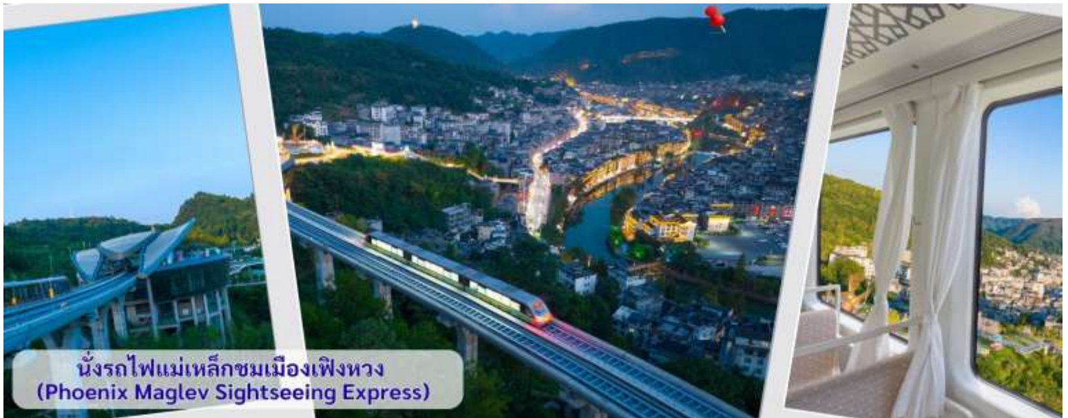
นั่งรถไฟแม่เหล็กชมเมืองเฟิงหวง (Phoenix Maglev Sightseeing Express)

นำท่านเดินทางโดยรถไฟชุปปรับอากาศเข้าสู่ เมืองโบราณเฟิงหวง (เมืองหงส์) ใช้เวลาเดินทางประมาณ 3 ชั่วโมง นำทุกท่านนั่งรถไฟแม่เหล็กท่องเที่ยวเฟิงหวง (Phoenix Maglev Sightseeing Express) เป็นรถไฟแม่เหล็กสายแรกของจีนที่ผสมผสาน "คมนาคม + วัฒนธรรม + การท่องเที่ยว" วิ่งเชื่อมระหว่างสถานีรถไฟความเร็วสูงเฟิงหวงและเมืองโบราณเฟิงหวง เพื่อเปลี่ยนการเดินทางให้กลายเป็นประสบการณ์ท่องเที่ยวแบบครบวงจร ลงสถานีชมวิวมืองโบราณเฟิงหวง (จุดไฮไลต์) ชม ตัวอาคารดีไซน์คล้าย "ดวงตานกฟีนิกซ์" มีระเบียงชมวิวกว้าง 3 ชั้น มองเห็นแม่น้ำและเมืองโบราณอย่างชัดเจน ภายในมีจุดเช็คอินถ่ายรูป เช่น จักรยานไดนามิก ซิงช้า ปีกนกฟีนิกซ์ คาเฟ่หรู และนิทรรศการความรู้รถไฟแม่เหล็ก และมีทางเดินและลิฟต์ชมวิวเชื่อมต่อไปยังแม่น้ำถั่วเจียง สามารถเดินเที่ยวชมสะพานหนานฮวาและอาคารยกพื้นสูงอันเลื่องชื่อได้ นอกจากนี้ตลอดเส้นทางยังผ่านวิวธรรมชาติที่สวยงาม เช่น หุบเขา ทุ่งนา ทะเลดอกไม้ และอุโมงค์มิติต่างๆ เป็นเส้นทางที่ผสมผสานความสงบของชนบทหูหนานเข้ากับความล้ำสมัยของเทคโนโลยีได้อย่างลงตัว