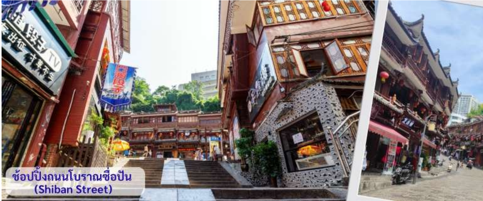
ข้อปิ้งถนนโบราณซีปิ่น (Shiban Street)