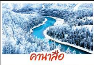
ดาเนาสิ้อ

ลู่อุทยานระดับโลก ชมความงามของอ่าวเสี้ยวจินทรา อ่าวซ็อนมิงกรและอ่าวเทพทวดคา หมู่บ้านหุบป่า เยือนหมู่บ้านไม้ซุงสุดคลาสสิก พร้อมจับจุดชมวิวกุหลาบยามเช้า นครปีศาจจิ้งจอก บึงรถไฟขิมวิว ก่อตั้งแดนดินแดนหิมะที่ถูกลบแกะสลักอย่างวิจิตร