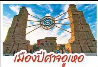
เมืองปีศาจจิ้งจอก