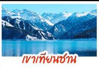
เขาเทียนชาน