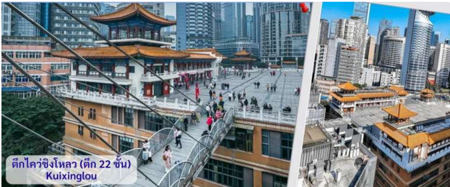
ตึกไควชิงโหลว (ตึก 22 ชั้น) Kuixinglou

นำท่านเดินทางไปชมความแปลกใหม่ที่ ตึกไควชิงโหลว (ตึก 22 ชั้น) Kuixinglou ชั้น 1 กลายเป็นชั้นที่ 22 ของอีกฝั่ง อาคารเก่าแก่ซึ่งมีหัตถกรรม ยังเป็นสถานที่ถ่ายทำภาพยนตร์เรื่อง "Young You" โดย Yi Yang Qianxi "Kui Xing Tower" อาคารโบราณที่ตั้งอยู่ในเมือง ที่นี้ได้รับการต่อเติมและสร้างขึ้นใหม่ในปี 1991 สิ่งมหัศจรรย์ที่สุดที่นี่ไม่ใช่ตัวอาคาร แต่เป็นสะพานแขวนสองแห่งระหว่างจัตุรัสกับอาคารสำนักงาน สะพานแขวนที่เต็มไปด้วยรถกลมเชื่อมระหว่างชั้น 1 ของจัตุรัสกับชั้นบนสุดของชั้น 22 ฝั่งตรงข้ามมองลงมาจากชั้น 1 จะเห็นได้ว่าด้านล่างมี 22 ชั้น เป็นอาคารที่มีลักษณะพิเศษที่เมืองฉงชิ่ง ประเทศจีน เนื่องจากภูมิประเทศที่เป็นภูเขา อาคารแห่งนี้จึงมีทางเข้าในระดับที่ต่างกัน เป็นจุดถ่ายรูปและชมวิวที่โดดเด่นของเมืองฉงชิ่งที่ได้ชื่อว่าเป็น "เมืองสามมิติ"