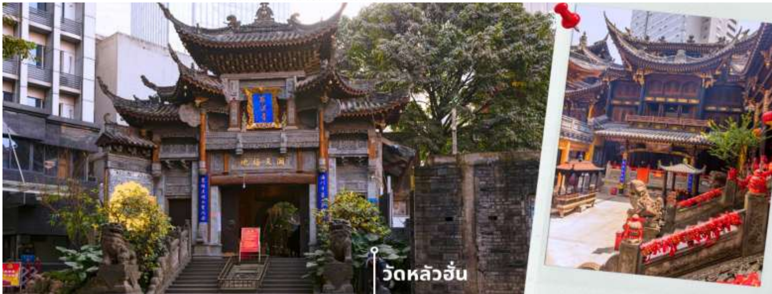
วัดหลัวอัน