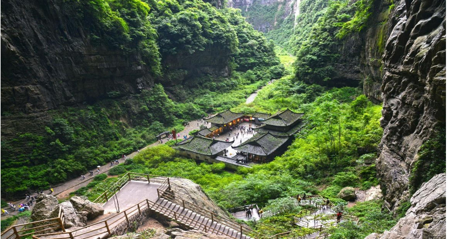
กลางวัน รับประทานอาหารกลางวัน ณ ภัตตาคาร (มือที่ 5)

การเปลี่ยนแปลงดังกล่าวอยู่นอกเหนือการควบคุมของบริษัทฯ จึงไม่สามารถคืนเงินค่าบริการในส่วนนี้ได้ โดยบริษัทฯ จะยึดตามประกาศจากทางอุทยานฯ เป็นสำคัญ