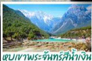
ภูเขาพระจันทร์สีน้ำเงิน