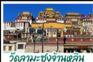
วัดลามะซงจ้านหลิน

ภูเขาหิมะมังกรหยก - วัดลามะซงจ้านหลิน รถไฟชมวิวภูเขาหิมะมังกรหยก ร้านกาแฟ MOYE CLIFF COFFEE ช่องแคบเสือกะโรจิน ภูเขาพระจันทร์สีน้ำเงิน เมฆพิเศษ สุกี้ปลาเซลมอน สุกี้หืด อาหารกวางตุ้ง