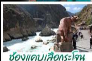
ช่องแคบเสือกะโรจิน