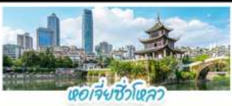
เจียงเซวี่ไฮลวด

ผ่านชมสะพานหุบเขาหาวจา จึง สะพานแขวนที่สูงที่สุดในโลก ชมปราสาทลับคิสนีย์ XINGYI JILONGBAO CASTLE แห่งมณฑลกุ้ยโจว น้ำตกหวงกู่ (รวมบันไดเลื่อน) • ชมหอเจียซิวโหลว (JIAXIU TOWER) สัญลักษณ์และแลนด์มาร์กสำคัญของเมืองกุ้ยหยาง มณฑลกุ้ยโจว