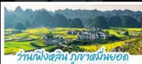
ว่านผิงผิงลีน ภูเขาเขม่านยอด