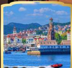
ท่าเรือประมงต้าเหลียน