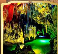
ถ้ำน้ำเป็นซี