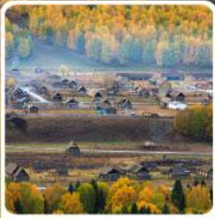
หมู่บ้านเหมอู่

สวรรค์ใบไม้เปลี่ยนสี เยือนคานาสีอแดนฝัน มหัศจรรย์หมู่บ้านเหมอู่ เคอเคอทิวไห่อัศจรรย์ภูผาหิน