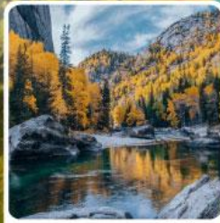
เคอเคอทิวไห่