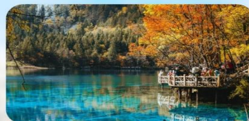
จิ้งจ้ายโกว