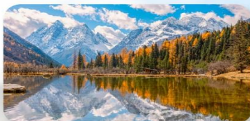
สี่ดรุณี