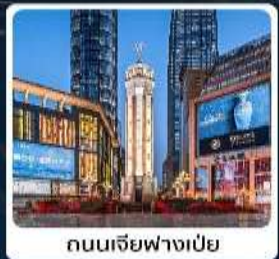
ถนนเจียฟางเป่ย์