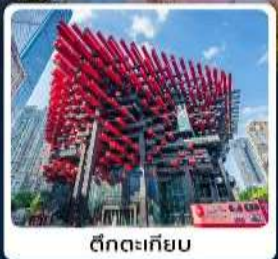
ดึกตะเกียบ