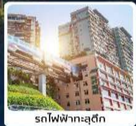
รถไฟฟ้าทะลุติ๊ก