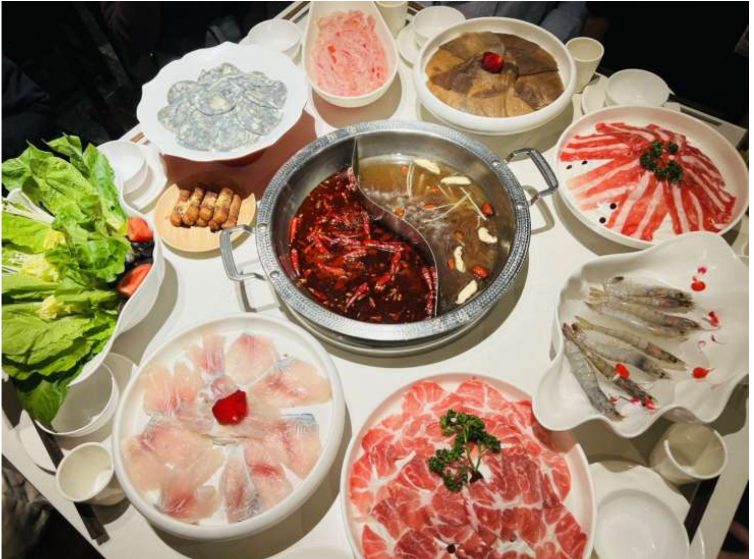
คำ รับประทานอาหารคำ ณ ภัตตาคาร (เมื่อที่ 9) *เมนูพิเศษ สุกี้หม่าล่าเสฉวน